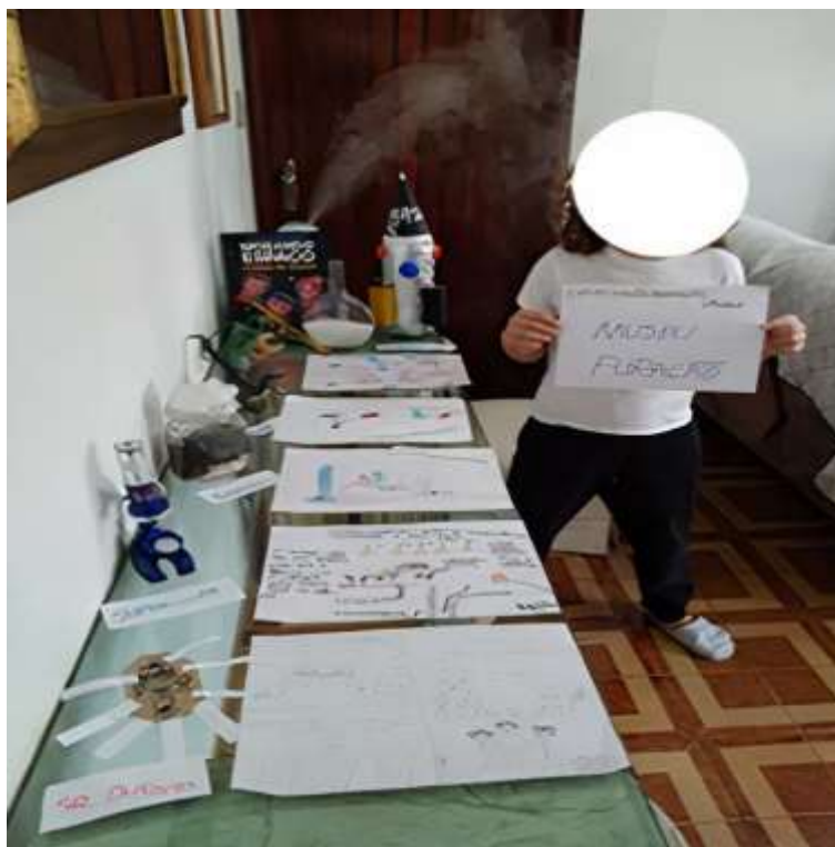
Figura 4: Exposição de C3

em cima tá escrito “mais mulheres astrônomas” eu acho, aí embaixo a experiência da água potável, ali a gente escreveu o negócio do jornal e o outro é de uma bactéria boa e uma bactéria ruim e tem um a lupa, um pão e uma giárdia; e aqui tá o terrário”.