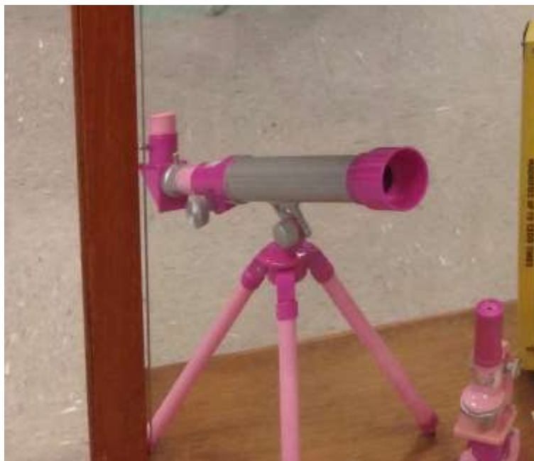
Figura 1. Telescópio e microscópio rosa

2º momento: O que é um museu? - Neste momento, foi realizado um levantamento acerca dos conhecimentos e experiências prévias dos grupos em relação aos museus, por meio da elaboração de um desenho. Ao finalizarem, as crianças explicaram seus desenhos, relatando suas vivências em diferentes museus. Este momento foi finalizado com a leitura da história “Gaspar e Lisa no Museu” de Anne Gutman e Georg Hallensleben (2010), que narra a visita de um grupo escolar ao museu de História Natural. O foco da narrativa está nos personagens Gaspar e Lisa, dois animais antropomorfizados, que durante a visita experimentam virar parte do acervo do museu sem que os outros visitantes percebessem. A história conta com outros acontecimentos que instigam as crianças e possibilitam aproximações com características e representações de museus, assim como ações presentes no processo de musealização.