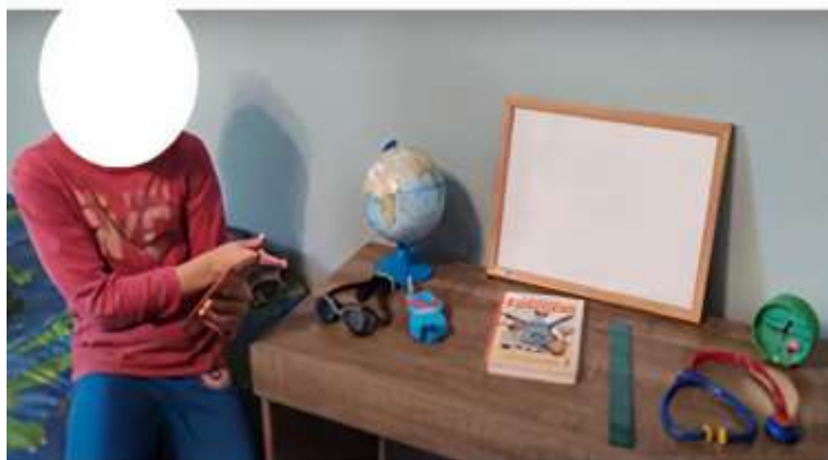
Figura 2: Exposição de C1

A criança C1 ao apresentar a sua exposição (figura 2) explicou o porquê da seleção dos objetos. Segundo esta criança: "o livro de ciências, cientistas usam para escreverem, se quiserem escrever um livro sobre esse tema ciência, a régua para medir algumas coisas, o walktalk se comunicam quando não tem internet ou não tem celular, a lousa para fazer algumas estratégias no experimento, relógio para ver o tempo, óculos de mergulho para ir na água e ver o que tem de interessante, globo terrestre para ver os países, as cidades, tudo."