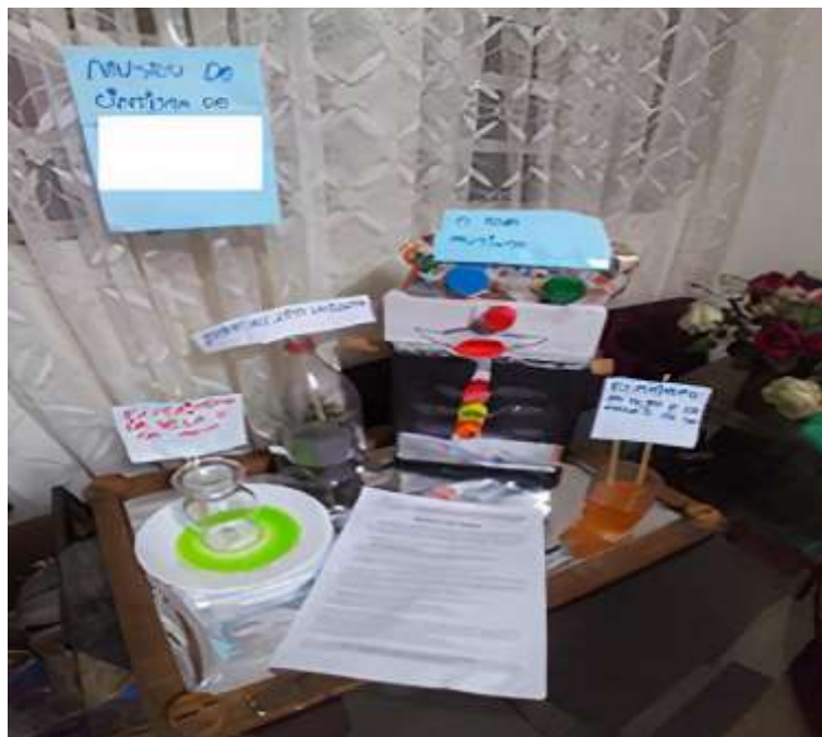
Figura 5: Exposição de C4

O último exemplo trazido neste relato é o da criança C4 que deu o nome para o seu museu de “Museu do Cientista [nome da criança]” (figura 5). Ao contar sobre os objetos escolhidos para a exposição, a criança menciona: “tem um robô, um nome [Robô Multiuso], tem a experiência da vela que eu coloquei água, corante na água, coloquei uma vela dentro, perto, dentro da água, coloquei um copo, acendi a vela e a água começou a subir e a vela apagou. E tem o vulcão, que é o laranja, eu coloquei o corante laranja na água, óleo e sal, aí eu não mexi e começou a sair bolha...e o terrário, nasceu bastante planta, uma borboleta...”